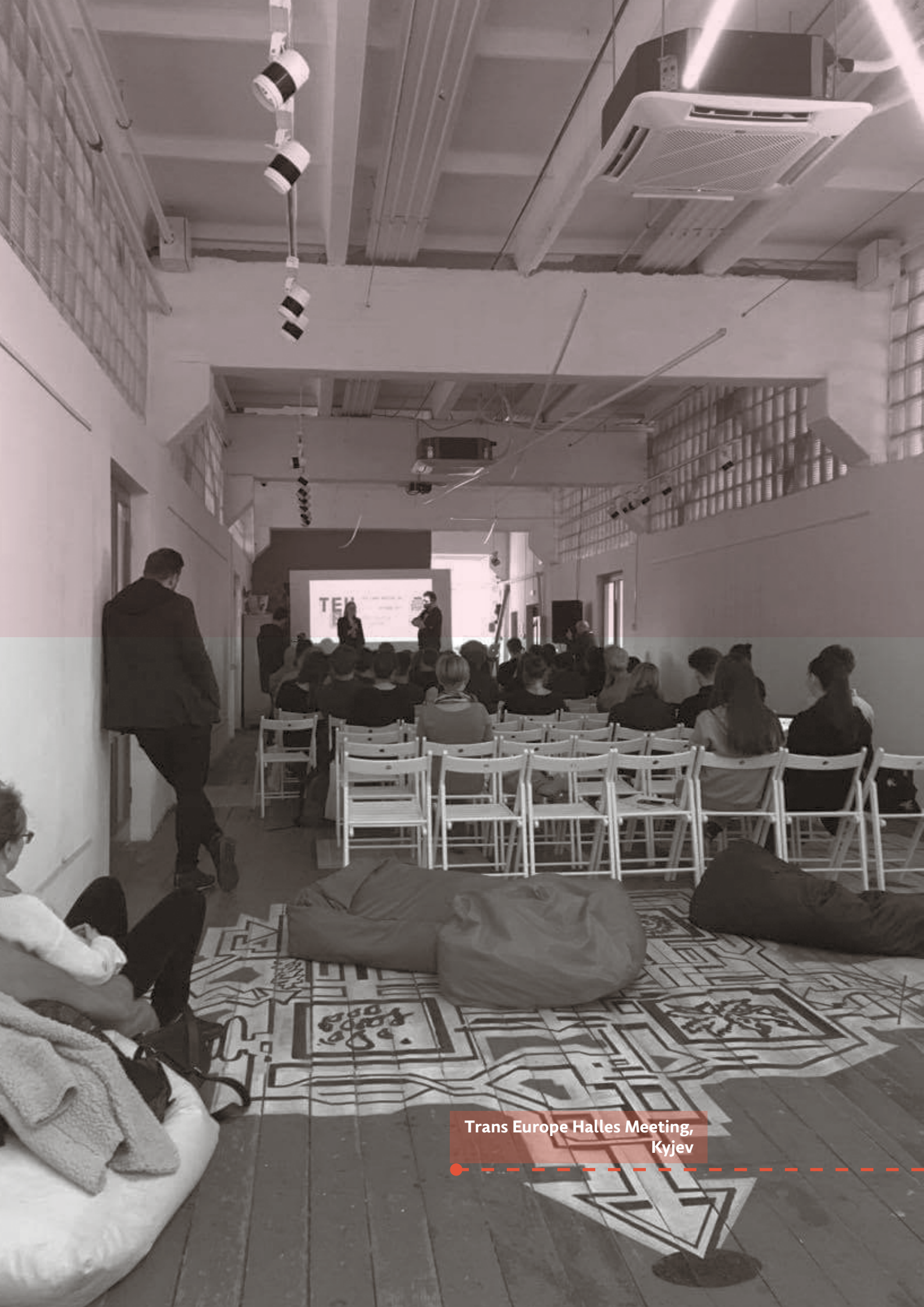
Trans Europe Halles Meeting, Kyjev