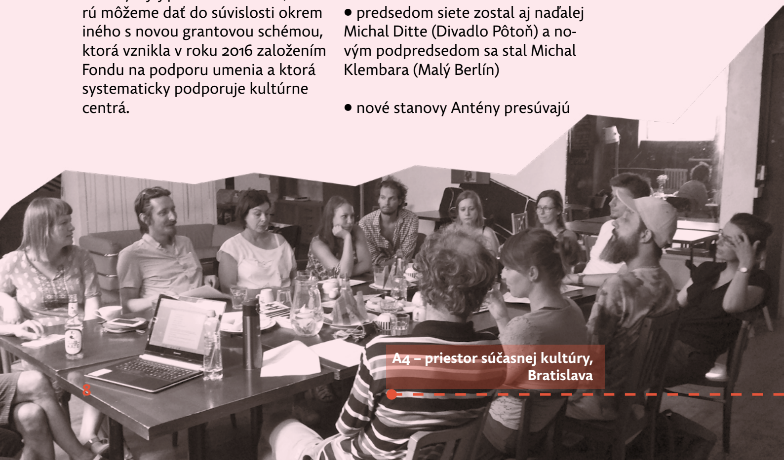
A4 – priestor súčasnej kultúry, Bratislava