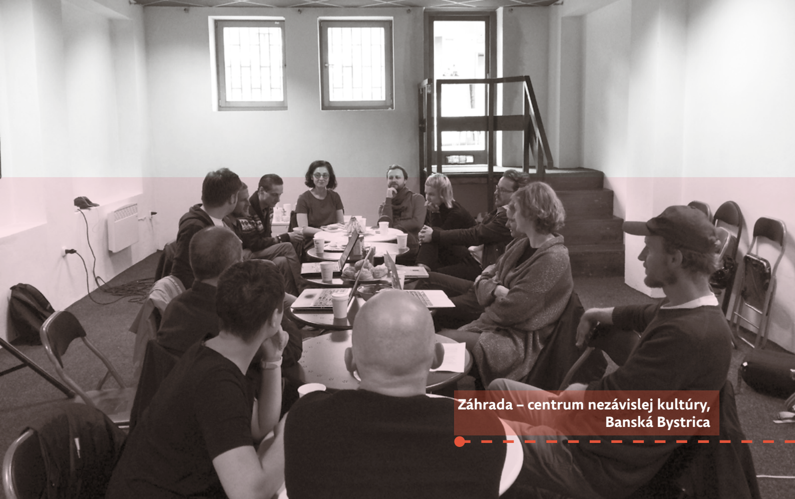
Záhrada – centrum nezávislej kultúry, Banská Bystrica

sídlo siete do Košíc (Tabačka Kulturfabrik, Gorkého 3 Košice)