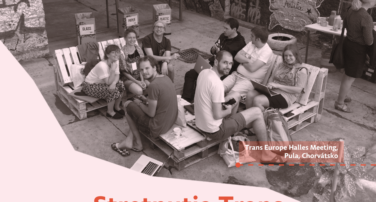
Trans Europe Halles Meeting, Pula, Chorvátsko